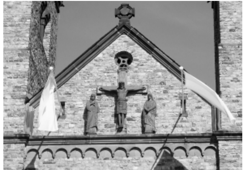
Kreuzigungsgruppe an der Giebelwand zwischen den beiden Kirchtürmen, mit Maria und Johannes.

Betritt man den Kirchenraum, so umfängt den Besucher eine ganz eigene zur Besinnung einladende Atmosphäre, er wird von ihm in Bann gezogen. Anmutig und geheimnisvoll wirken die Wandgemälde aus der Beurer Kunstschule. Deren Kunst ist mythische, liturgische und damit zugleich auch monastisch-benediktinische Kunst. Sie atmet Frieden und ist zeitlos. Die Architektur und die Malerei strahlen zusammen eine unwandelbare Ruhe und Majestät aus. Es gibt wohl kaum eine Kunstrichtung, die das