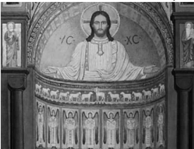
Blick auf das Christusbild in der Apsis der Abteikirche.

An der Längswand zwischen den Fenstern finden sich ebenfalls Gemälde heiliger Benediktinerinnen. Beim Verlassen der Abteikirche erblickt man über dem Hauptportal eine Inschrift. Diese ist dem Gründer und Erbauer des Klosters und der Kirche, Fürst Karl zu Löwenstein, in Dankbarkeit gewidmet. Was er im Jahr 1900 grundgelegt hat, trägt bis heute viele Frucht. Die Abteikirche der heiligen Hildegard ist alljährlich Ziel tausender von Pilgern und Besuchern, die auf den Spuren der großen Heiligen nach Eibingen finden und mit den Schwestern der Abtei gemeinsam das Gotteslob feiern.